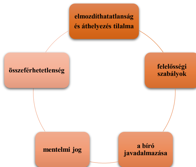
2.ábra: A személyi függetlenséghez tartozó garanciák /Saját ábra/

Az ábra a bírói függetlenség egymástól elválaszthatatlan elemeit mutatja, amely egy megszakítás nélküli körforgásban az érvényesülés folyamatosságára utal. Az ábrát azért készítettem, hogy – az esszémből – a jobb szemléltetés érdekében kiemelhető legyen, hogy az egyes garanciák nem egymásból következnek, hanem együttesen kell érvényesülniük.